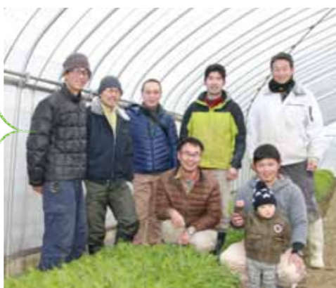
滋賀有機ネットワーク 栗東有機栽培グループの皆さん

水菜はクセがない野菜なのでどんな料理にも合います。鍋やみそ汁、塩昆布和えに浅漬け……。ピリ辛の調味料を和えてナムル風にしたリ、生春巻きや千切りミの具材にするのもおすすめです。一番手軽な食べ方は、やっぱりサラダ。しっかり水をきってから刻み、マヨネーズやドレッシングなどの調味料と和えてしばらくおくと、味がしっかりなじんでおいしいですよ。いろいろな料理で、シヤキシヤキとした「産直水菜」の食感を堪能してください!