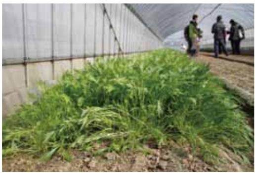
やわらかな土に生えた水菜。ハウスには防虫ネットを張り、害虫を寄せ付けません。

「栗東有機栽培グループ」が属している「滋賀有機ネットワーク」は、1994年に生産者が立ち上げた会社です。食の安全や環境保全型農業をテーマに、企画や生産計画などを統括することで安定供給を目指した組織で、滋賀県内の安土、大中、栗東の3つのグループから成り立っています。