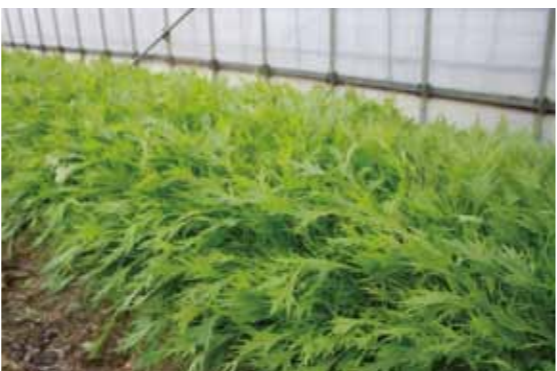
みずみずしく育ち、収穫を待つ水菜

なかでも、後継者育成や新規就農者の受け入れに積極的で、現在20名のうち若手が半数を占めるのが、「栗東有機栽培グループ」です。名称が表すように、グループ最大のテーマは、有機肥料での野菜作り。水菜に限らず、化学肥料を使わないという点ではどの品目も同じです。ほかに、除