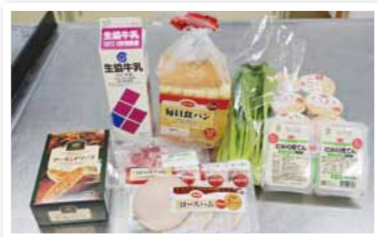
こんな商品を試食しました！ (どの会場も試食商品はほとんど同じです)