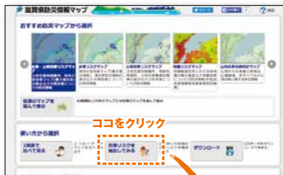
防災情報マップのトップページ

手始めに「災害リスクを抽出してみる」をクリックし、お住まいの地域をポイントしてみてください。そうすれば、周辺の活断層から推定される地震の最大震度や液状化の危険度、雨量ごとに想定される浸水の深さといったリスクが一覧で表示されます。この地図を印刷し、家族で決めた避難所や避難経路を書きこんでおけば、オリジナルのハザードマップが出来ます。いざという時のために、事前の情報収集はとても大切なことです。