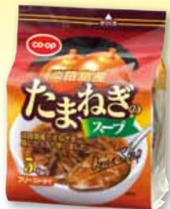
淡路島産 たまねぎのスープ

時間がないときに大活躍する、便利で質の良い加工食品。その種類は年々増え、組合員の強い味方になっているようです。今回は、東地区甲賀市西地域委員会の方々に、家でストックしているお気に入りの商品を紹介してもらいました。