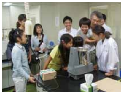
食事調査に参加した家族が日本生協連商品検査センター（埼玉県蕨市）を訪問。放射性物質の測定を体験しました

人々の心のケアも必要になってくるでしょう。 県内の生産者にとって深刻なのが、風評被害による売り上げの落ち込みです。国が定めた食品に含まれる放射性物質量は、1kgあたり1000ベクレル以下。現在、市場に流通している県産の農産物はすべて基準値を下回っています。日本の放射性物質に対する基準は世界的に見ても厳しいものです。「安心」を押しつけることはできませんが、この数値の意味をご理解いただきたいと思います。 県内の生産者は、安全安心な農産物を消費者に届けるため、自治体や研究機関と共に土壌や樹皮の除染を行うなど、日々努力しています。「コープふくしま」も参加する地産地消運動促進ふくしま協同組合協議会では、「福島のおいしいもの」を消費者