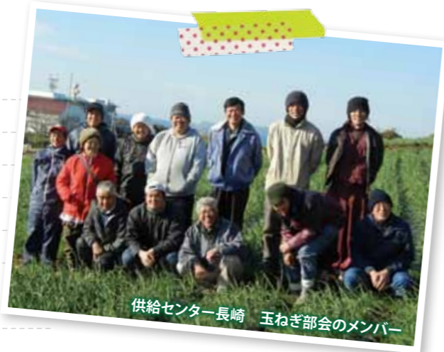
供給センター長崎 玉ねぎ部会のメンバー

コープしがの組合員さんに喜んでいただけるよう、安全安心にこだわり、年間ひまかけて作っています。気まぐれな自然相手の仕事ですが、良いものを生産する努力は惜しみません！食を通して農を知ってもらい、たくさん利用していただくと嬉しいです。太陽の光をたっぷり浴びた自慢の旬の味、たくさん楽しんでくださいね！