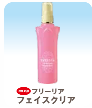
フリーリアフェイスクリア

つくる人*たべる人...2ページ やわらかくて甘い春の味覚 島原の新たまねぎ 私が見たらんだ マイコープ...5ページ お弁当便利グッズ 教えてください