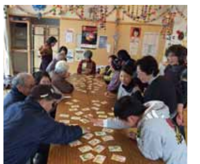
仮設住宅で暮らす皆さんとカルタ取り。お茶会を開いたり、ゲームをしたり…。