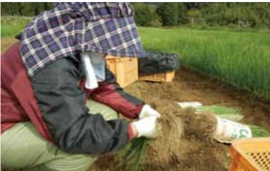
本畑への植え替え準備。良質な苗を選び、しっかり根付くように根の土をていねいに落します