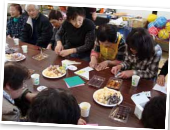
お茶会のかたわら、折り紙で交流を深めました。全国の生協などのご支援をいただきながら、避難されている方の心に寄り添う活動を進めています。

屋外での運動や外遊びの機会が減ったことで、お子さんの心身への影響も懸念されています。また、原発事故の直後は放射線に関する情報が少なかったこともあり、お子さんを連れて外出した親御さんもしばしば。そうした方々のなかには、「将来、子どもの健康に影響が出るのでは…」と自分を責めながらも、誰にも相談できずにいる方も多いためです。今後はこうした