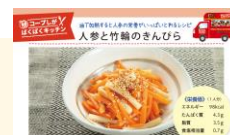
未就園児親子サロン 婦人会などにおすすめ