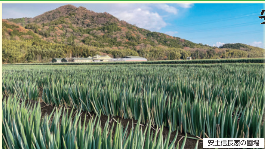
安土信長葱の圃場