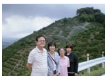
有田コープファーム小西参事と参加の理事