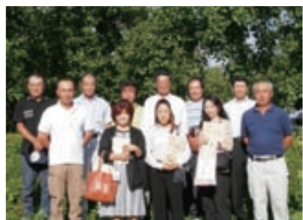
サン・くらふとの会8名の生産者と参加の理事