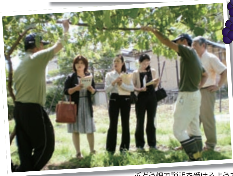
ぶどう畑で説明を受けるようす