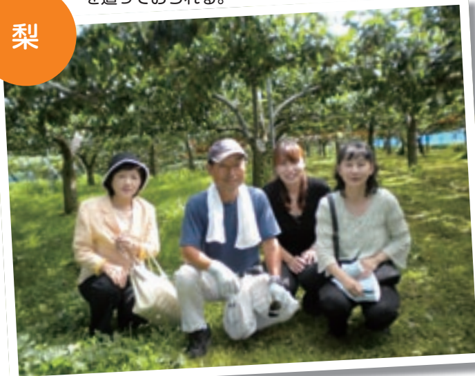
除草剤は一切使われない梨園

美味しさと安全性の両立を目指し、使用農薬の制限、使用肥料の選定、栽培記録のパソコン管理をいち早く行うなどの活動を行っている。