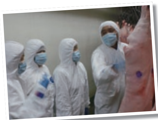
豚枝肉の説明を受けるようす

もともと金華豚は中国浙江省金華地区が原産の豚で、最高級中華食材『金華火腿（ハム）』の原料として知られています。平田牧場では1988年に中国より導入し、他の中国産原種豚とともに品種改良試験を続けてきました。原種『金華豚』の優れた持ち味を活かしながら、平田牧場が長年培った三元交配技術を活用して、肉質の安定性と効率性を高め、求めやすい価格の豚肉を目指して誕生したのが、金華豚交配種『平牧金華豚』です。