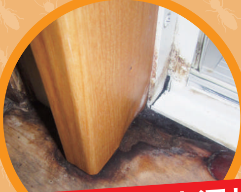
浴室・台所の水漏れ