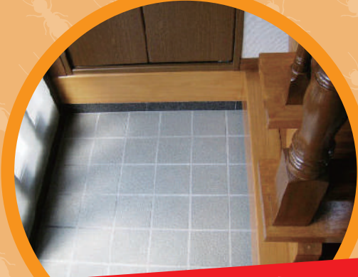
玄関や床のぶかつき