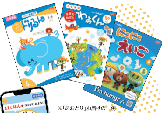
※「あおどり」お届けの一例