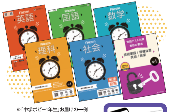
※「中学ポピー1年生」お届けの一例

紙+デジタルの学習で、忙しい中学生でも 生活スタイルに合わせて学べる！ 2025年度リニューアル！