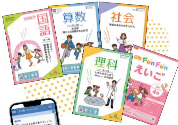
※「小学ポピー3年生」お届けの一例