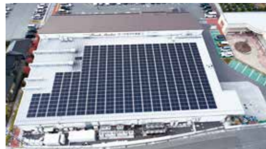
もりやま店の太陽光パネル