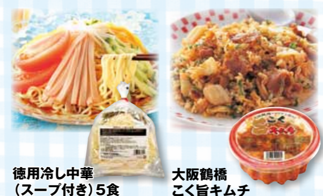
徳用冷し中華(スープ付き)5食

(*)エコーに載っているものは、 徳用冷し中華(スープ付き)5食 などがあります。