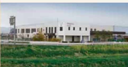
株式会社若草食品(奈良県北葛城郡)

1942年、奈良県橿原市に上杉商店として設立。1981年よりコープしがと取り引き開始。1970年代から生協組合やこんにやく芋生産者を対象にしたこんにやく芋の堆肥きゅうう肥による肥培管理の学習会を行うなど、品質管理に取り組み、生産情報の発信を続けている。