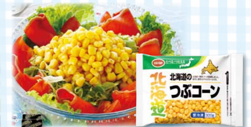
co-op 北海道の粒コーン