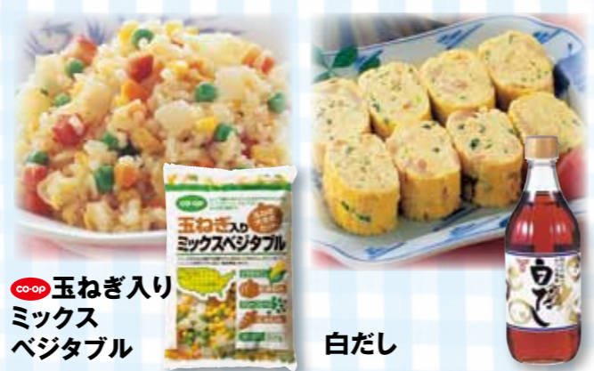
co-op 玉ねぎ入りミックスベジタブル

フンドーキンの 白だし をよく利用しています。玉子焼きの味付けや煮物はもちろん、夏はそうめんや冷奴などにも使えて便利。 co-op 玉ねぎ入りミックスベジタブル は、夫が自分でチャーハンなどを作る時に使っています。玉子焼きに入れてもおいしいですよ。