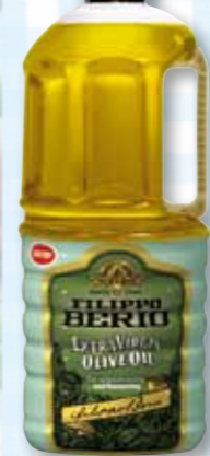
co-op エキストラバージンオリーブオイル