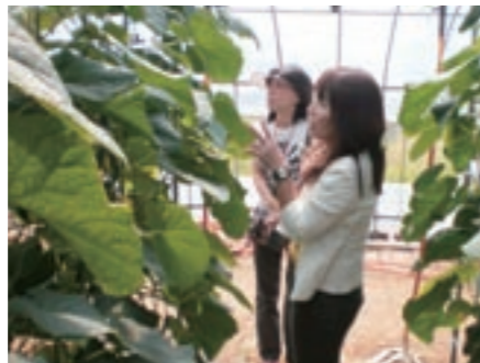
真夏には40℃を越えるハウスの中での生産作業。一日の収穫は2,000本。